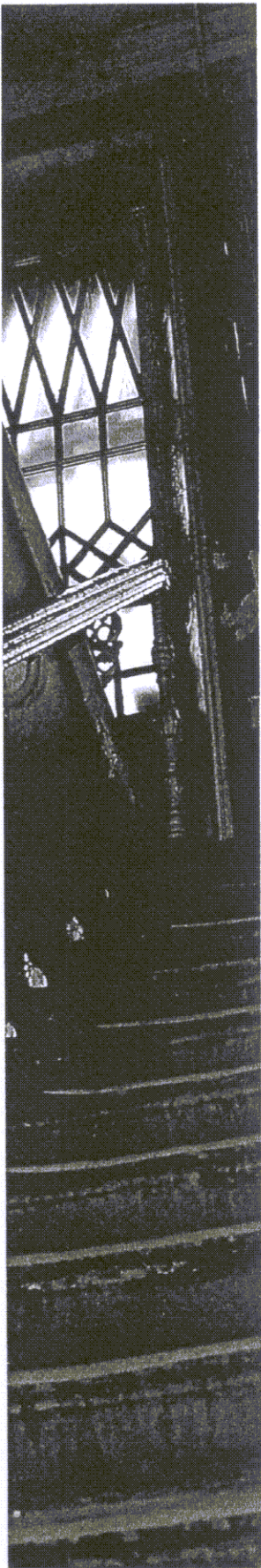
• МОМЕНТ СЪЕМАЮТ THE NEW TIMES

в чем честно и признался: «Мы как тогда о ней ничего не ведали, так и сейчас. Прозвучало название с адресом один-единственный раз в новостях, всех удивило, но на этом все закончилось. Больше ни о каких материальных следах этой конторы нам неизвестно, нигде и никогда она тут больше не упоминалась. Так что и понятия не имею, существовала ли она вообще тут у нас реально».