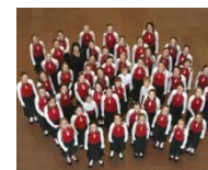
Детский хор «Щедрик»